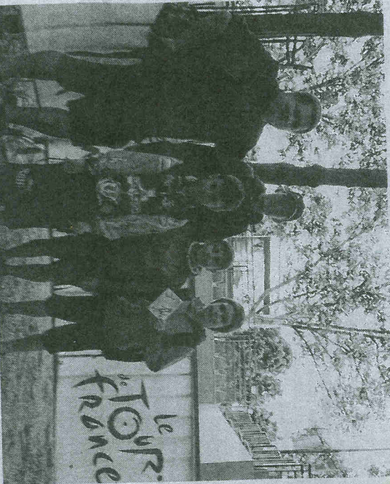
L'apothéose élyséenne !